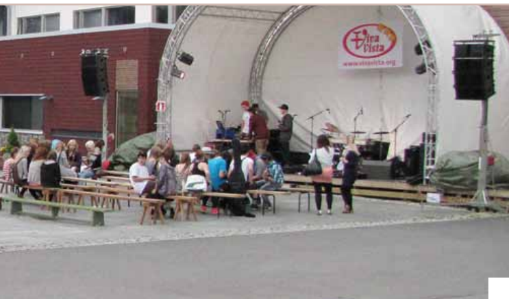
Evenemanget Viva Vista i Pemar.