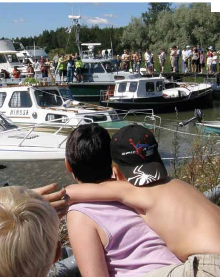
Sjusovarmarknaden i Rantola by, Karuna.

Det hör till verksamhetsutövarens skyldighet att ordna avfallshanteringen från en näringsverksamhet. Rouskis kan erbjuda tjänster också till företag.