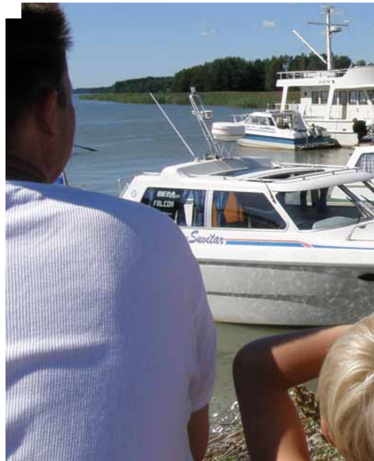
Unikeonmarkkinat Karunan Rantolan kylässä.

Rouskis ja kunnat eivät toimi yksin. Yhteistyötä tehdään paljon eri sidosryhmien, kuten yhdistysten, yritysten, erilaisten järjestöjen ja muiden jäteyhtiöiden kanssa. Yhteistyötä tehdään myös viranomaisten, kuten Varsinais-Suomen ELY-keskuksen ja Etelä-Suomen AVIn kanssa. Lisäksi Rouskis hankkii suuren osan esimerkiksi kuljetus- ja käsittelypalveluista yrityksiltä kilpailutettuina ostopalveluina.