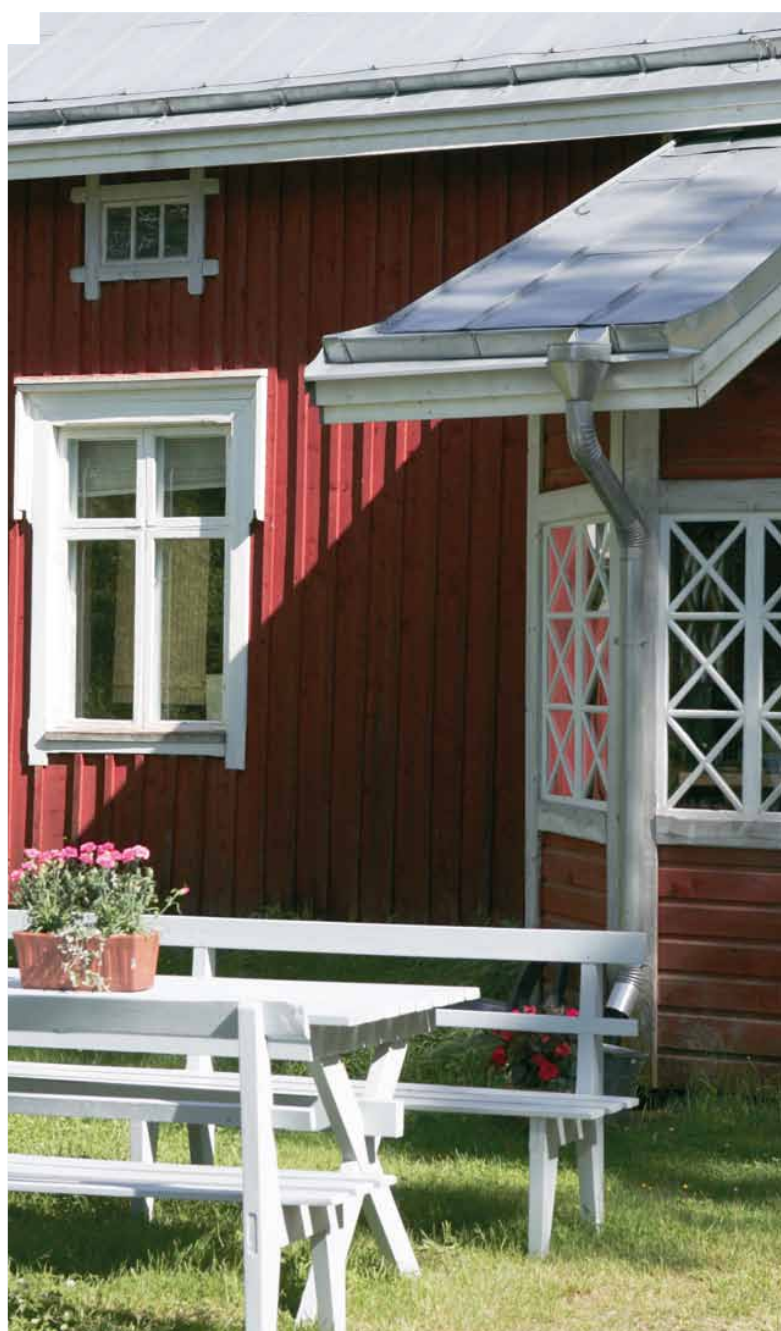
Sagu hembygdsmuseum. • Sauvon kotiseutumuseo.

Myndighetsuppgifter i enlighet med avfallslagen kan inte ges till avfallsbolaget för behandling. Myndighetsuppgifter är t.ex. beslut om avfallstaxor och betalningar i anslutning till dem samt avgöranden angående de allmänna avfallshandlingsbestämmelserna och avvikelser från dessa. Enligt den nya avfallslagen verkar delägar kommunernas gemensamma samarbetsorgan