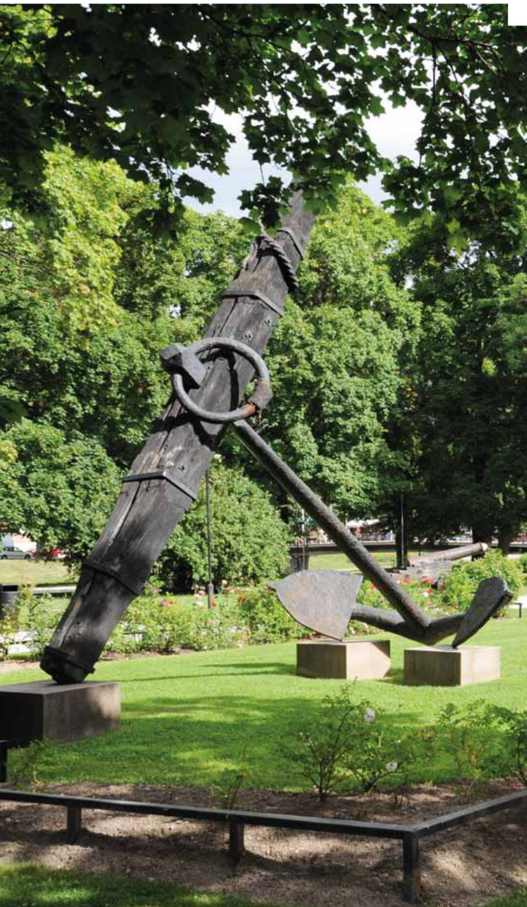
Ankkuripuisto, Salon tori. • Ankkuripuisto, Salo torg.