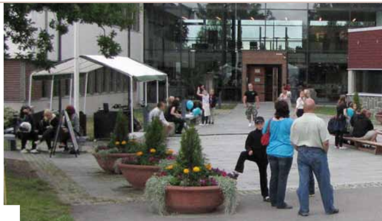
Viva Vista-tapahtuma Paimiossa.