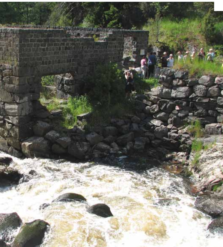
Latokartanonkoski, Salo. • Latokartanonkoski, Salo.

Kun jätelautakunnan perustamissopimusta tehdään, tulee erityisen huolella tarkastella myös jätehuollon rahoitukseen liittyvät asiat. Rahoitusmallin tulee olla tasapuolinen ja oikeudenmukainen kaikille osakaskunnasta ja asuinpaikasta riippumatta. Jos osakaskunnissa on esimerkiksi erilaisia jätteiden kuljetusjärjestelmiä, tulee toiminnan kokonaisuus olla kunnossa myös rahoituksen osalta.