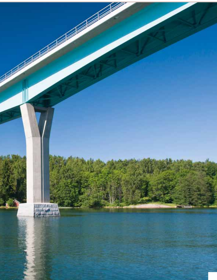
Lövö bro.